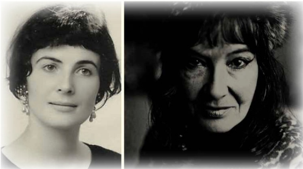
Deux portraits de Grisélidis Réal