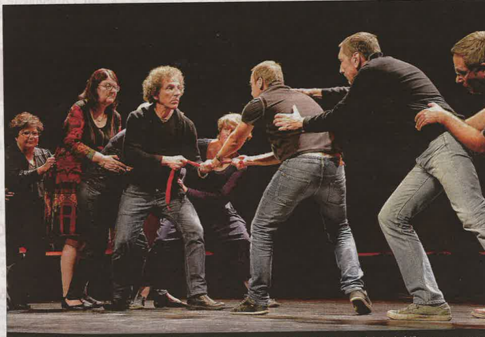
AMATEURS. Encadrés par la C° Puzzle Centre, les comédiens amateurs ont déjà joué Résistance, sel de la vie à Vierzon.

Basée sur des textes d'auteurs fameux – Brasens, Desproges... – mais