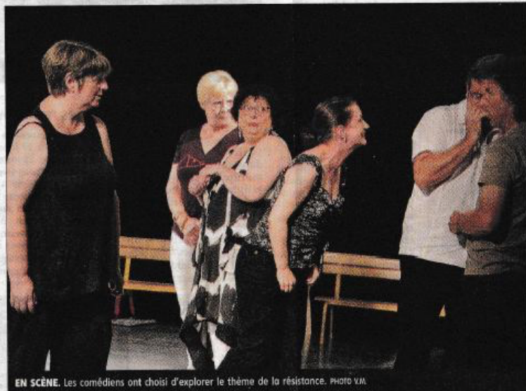
EN SCÈNE. Les comédiens ont choisi d'explorer le thème de la résistance.

Résistance, sel de la vie. Tel est le titre du spectacle qu'ils ont monté, fruit de plusieurs mois de labeur. Un corpus de dix-sept textes formé d'une sélection d'écrits de leurs auteurs fa-